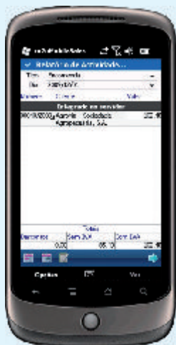
Relatório de Actividade