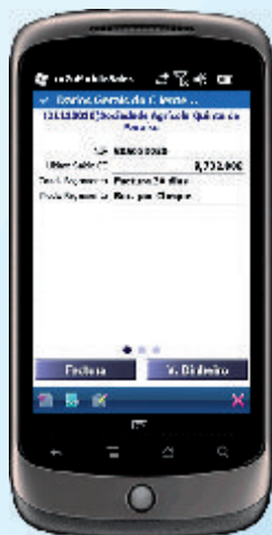
Dados Gerais do Cliente

folhas de despesas, Kms realizados e folhas de caixa. O PRIMAVERA Mobile Business Servidor permite ainda a consulta de alterações de dados de clientes e registos de novos clientes efectuados nos postos móveis, manutenção de um conjunto de frases tipo, para vários cenários, de forma a tornar mais rápida a escrita de informação complementar em documentos ou nos relatórios de visita. É mantido para consulta no backoffice, um registo detalhado de todas as sincronizações realizadas pelos PDA, de forma a permitir a detecção de eventuais problemas de sincronização ou comunicação. O backOffice é também responsável pelo interface de comunicação entre a aplicação e o sistema de gestão central.